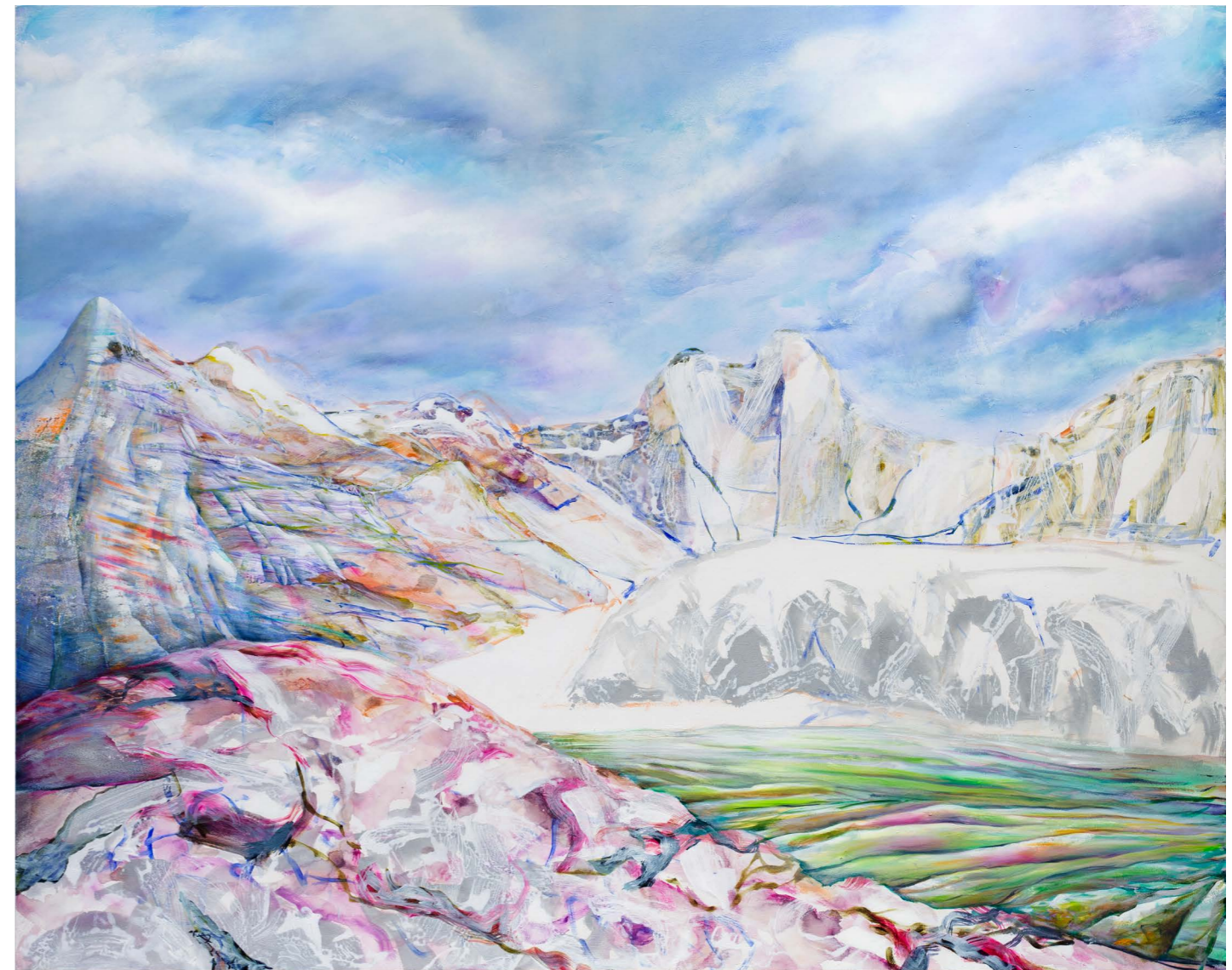
ARNGUNNUR ÝR SVÍNAFELLSJÖKULL I