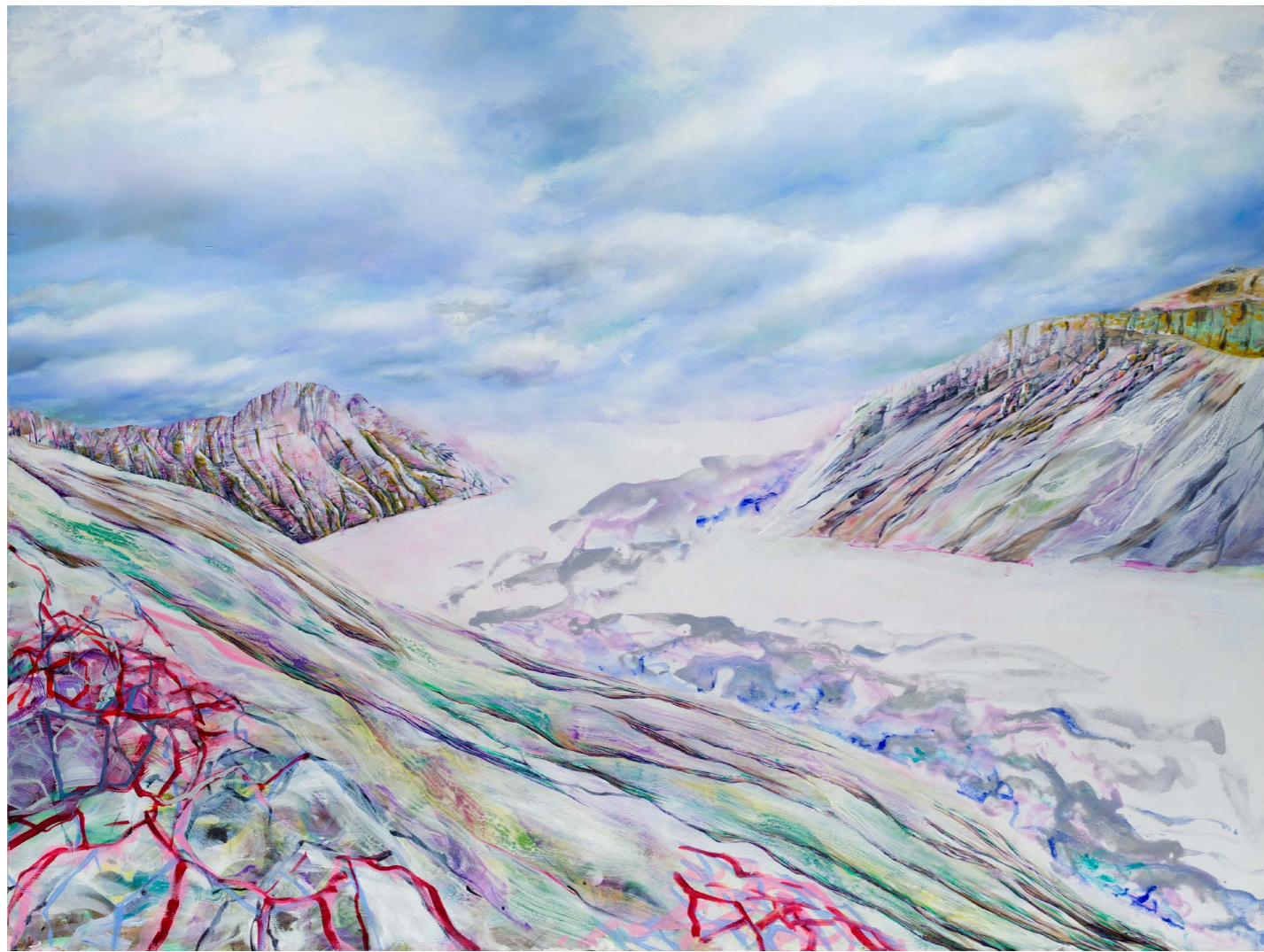
ARNGUNNUR ÝR SKAFTAFELL