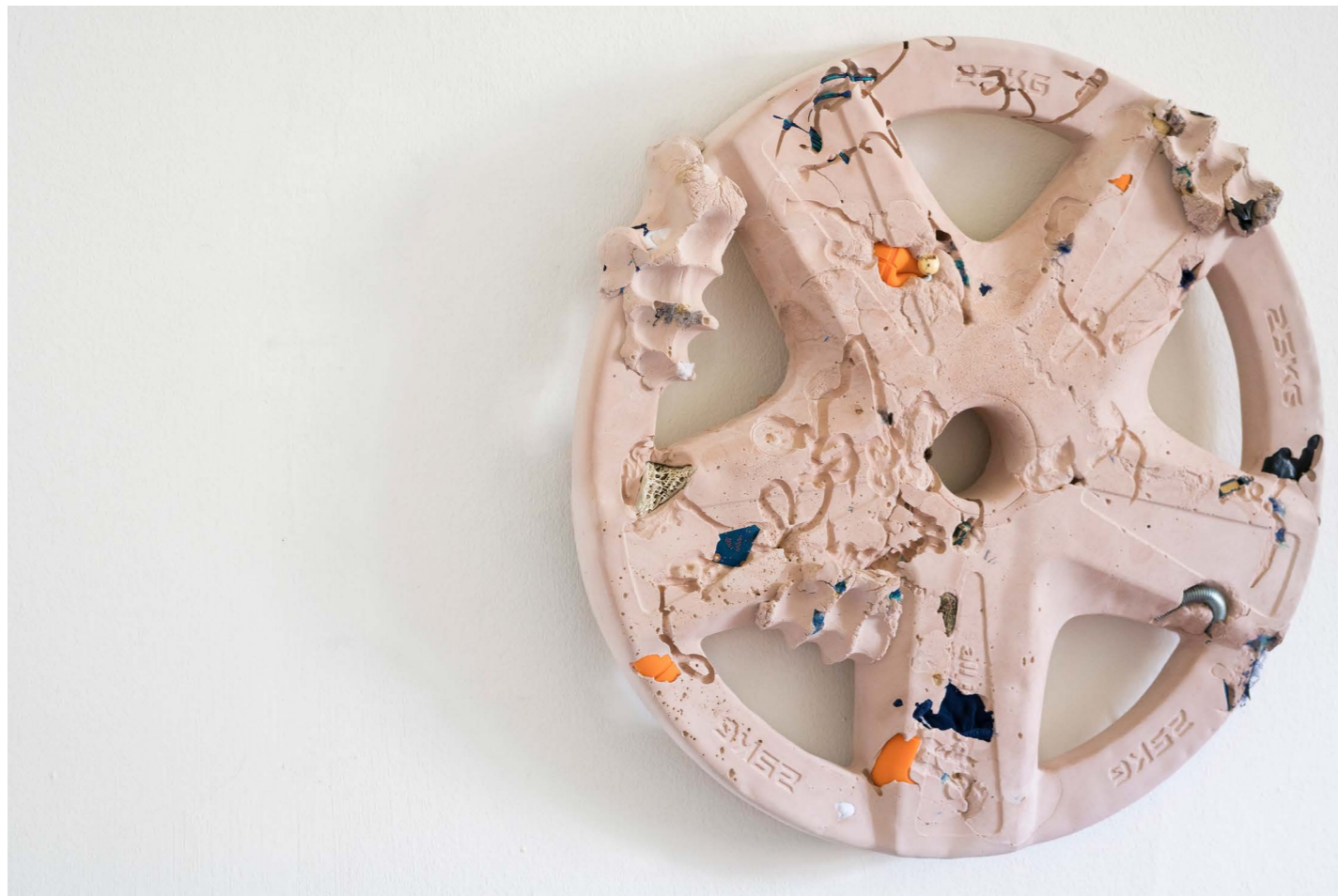
NESTORI SYRJÄLÄ TRILOBITEYOGAMATFAVABEANNEYELASHMAC- BOOKPROEUROCOINRUNNINGSHOEWEIGHTPLATE